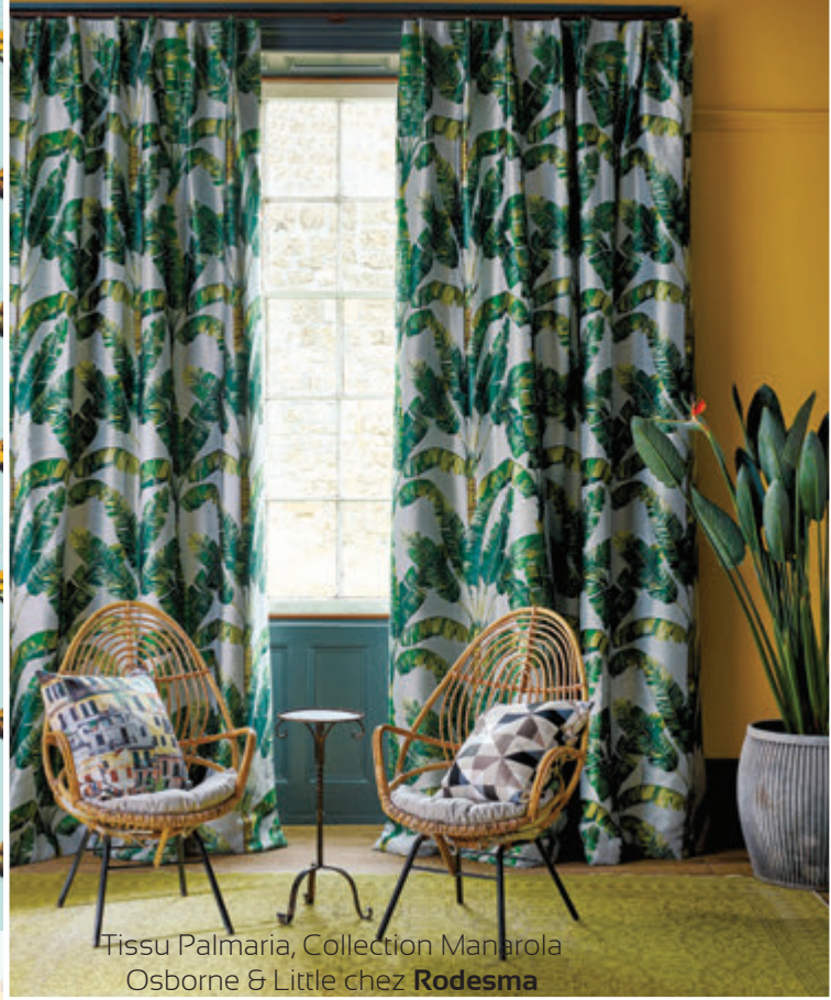
Tissu Palmaria, Collection Mangrola Osborne & Little chez Rodesma