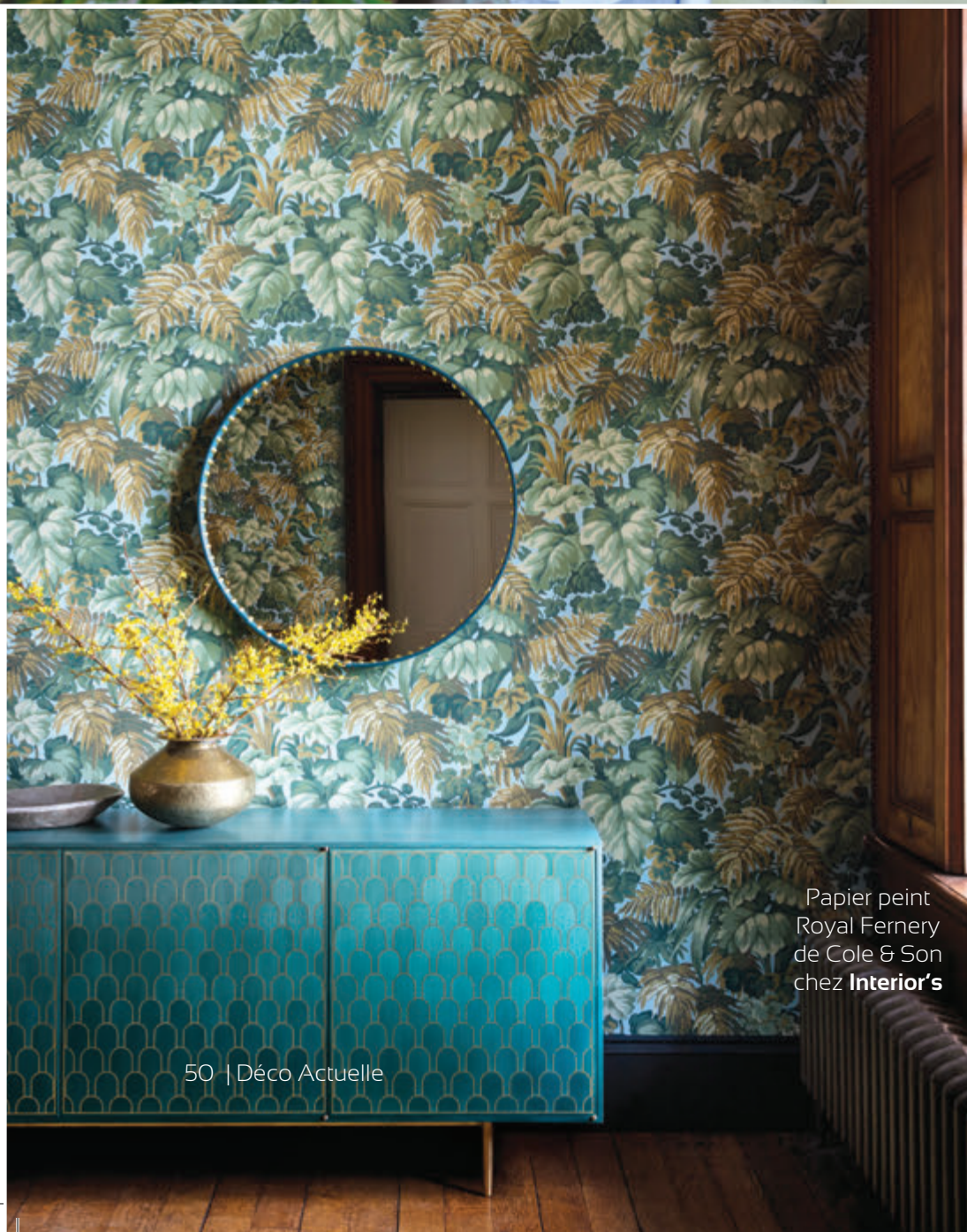
Papier peint Royal Fernery de Cole & Son chez Interior's