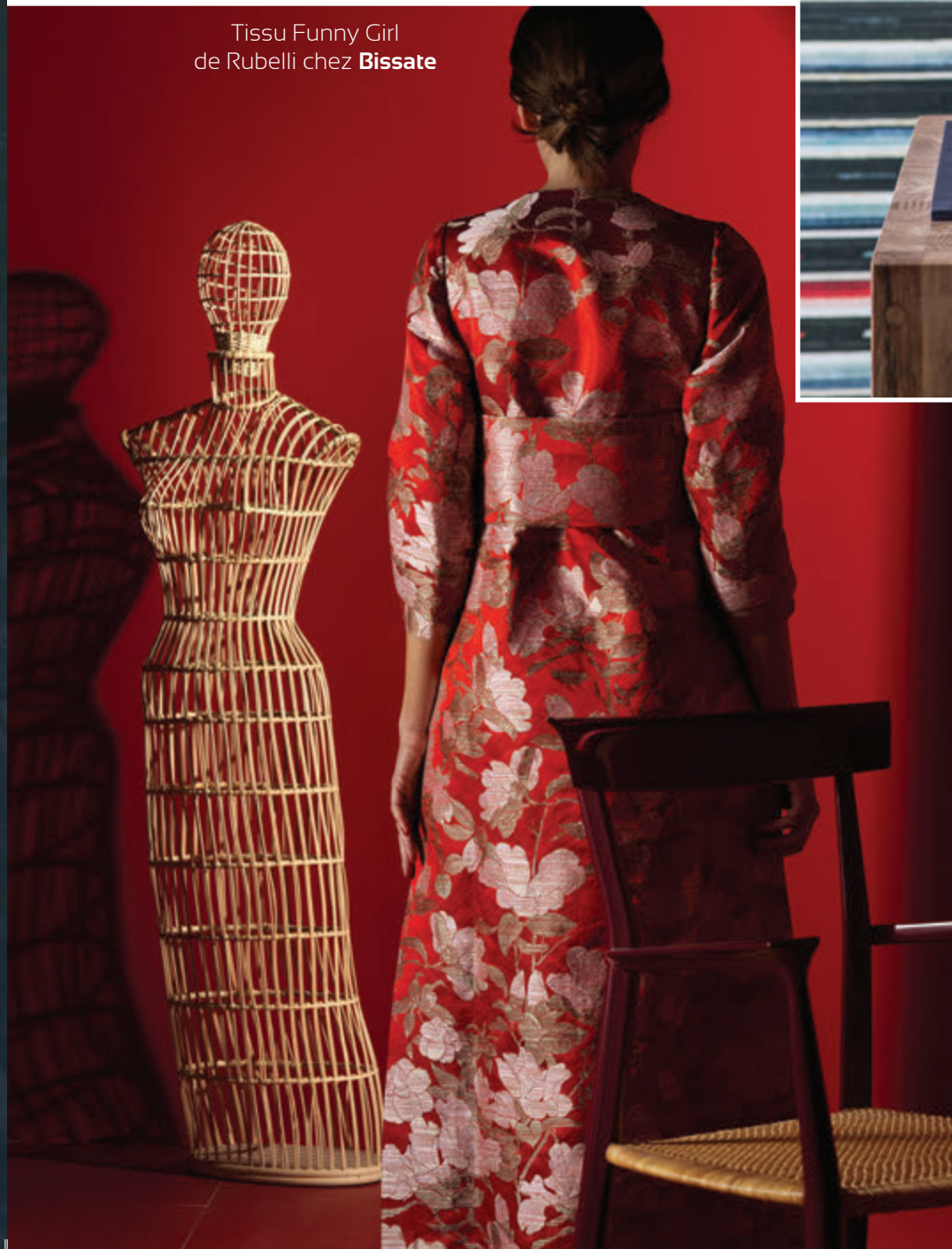
Tissu Funny Girl de Rubelli chez Bissate

De l'Amérique bohème et colorée des Indiens au Japon précieux, du romantisme des jardins anglais à l'exubérance végétale des Tropiques, tissus et papiers peints nous entraînent dans un voyage immobile inspirant.