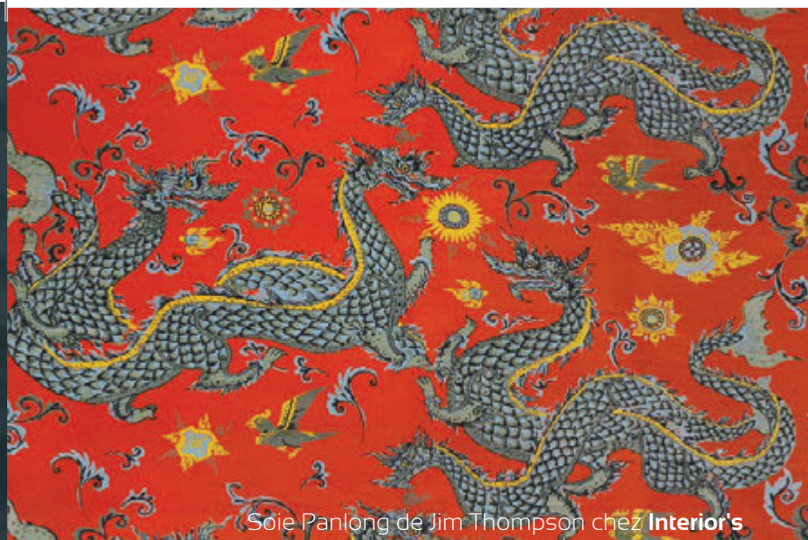
Soie Panlong de Jim Thompson chez Interior's