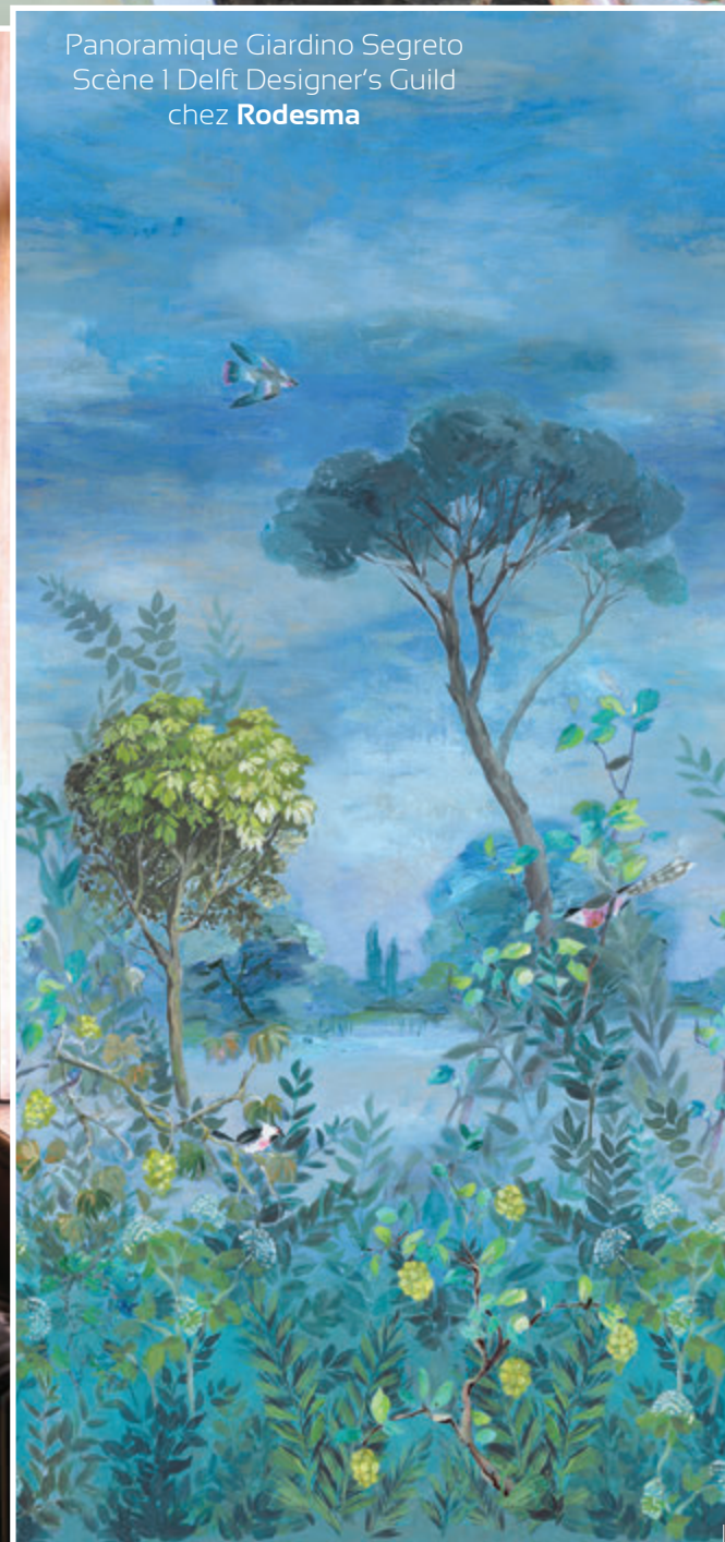
Panoramique Giardino Segreto Scène I Delft Designer's Guild chez Rodesma