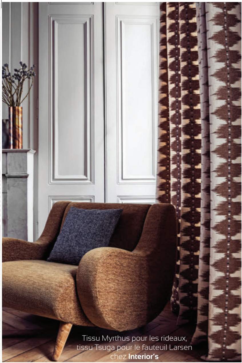
Tissu Myrthus pour les rideaux, tissu Tsuga pour le fauteuil Larsen chez Interior's