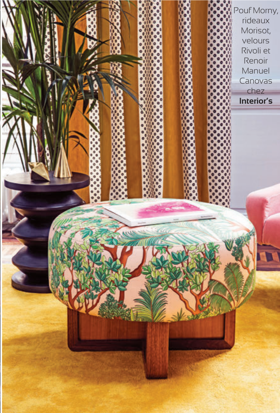
Pouf Morny, rideaux Morisot, velours Rivoli et Renoir Manuel Canovas chez Interior's