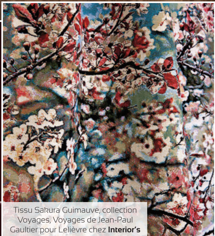
Tissu Sakura Guimauve, collection Voyages, Voyages de Jean-Paul Gaultier pour Lelièvre chez Interior's