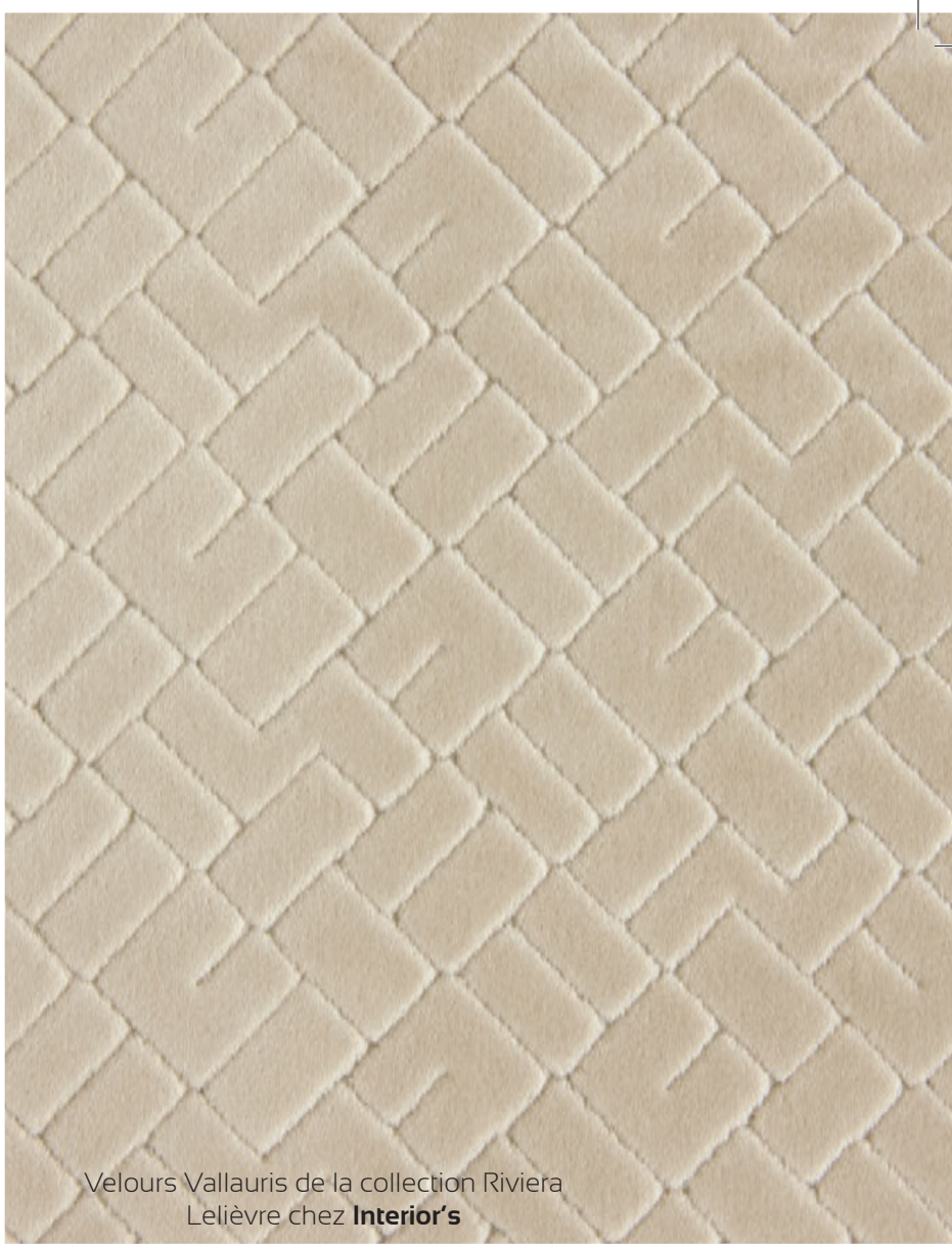
Velours Vallauris de la collection Riviera Lelièvre chez Interior's