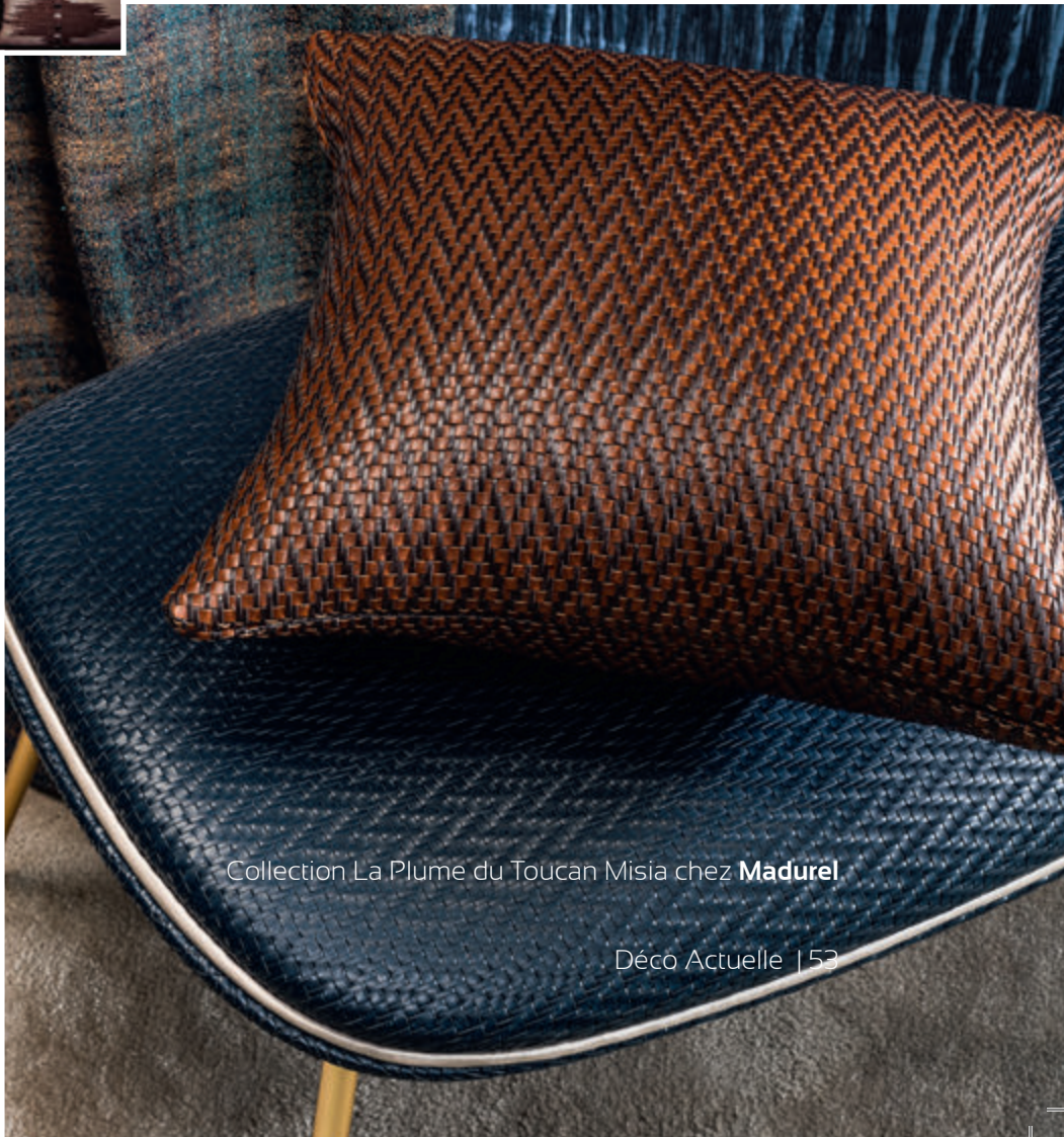
Collection La Plume du Toucan Misia chez Madurel