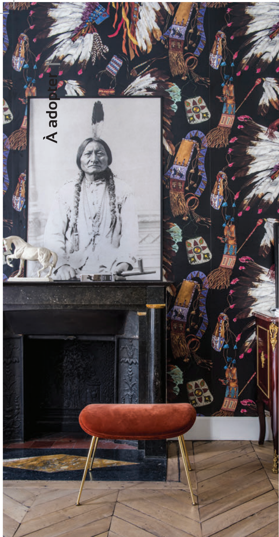
Papier peint intissé Grand Canyon Pierre Frey chez Interior's