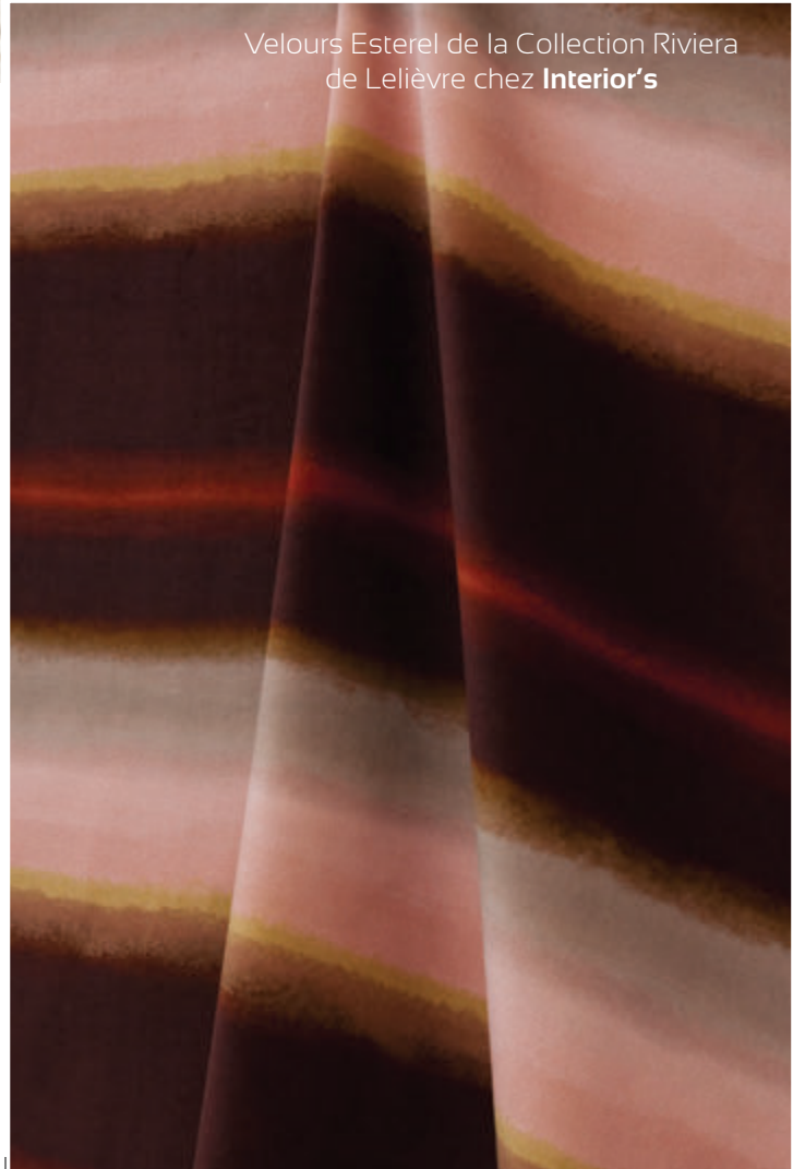
Velours Esterel de la Collection Riviera de Lelièvre chez Interior's