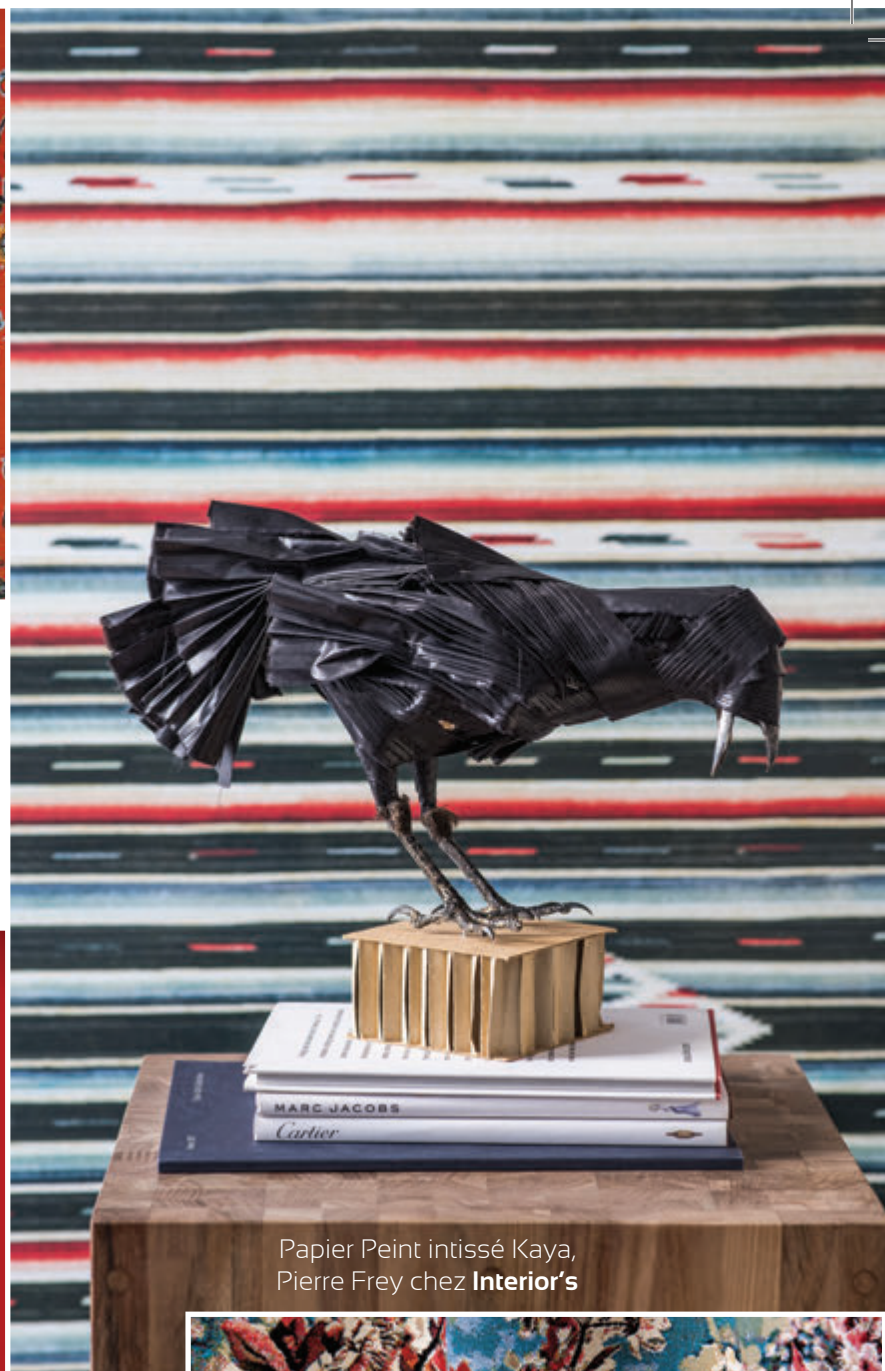
Papier Peint intissé Kaya, Pierre Frey chez Interior's