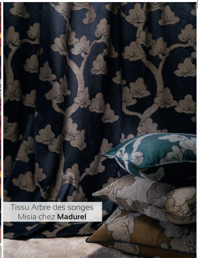
Tissu Arbre des songes Misa chez Madurel