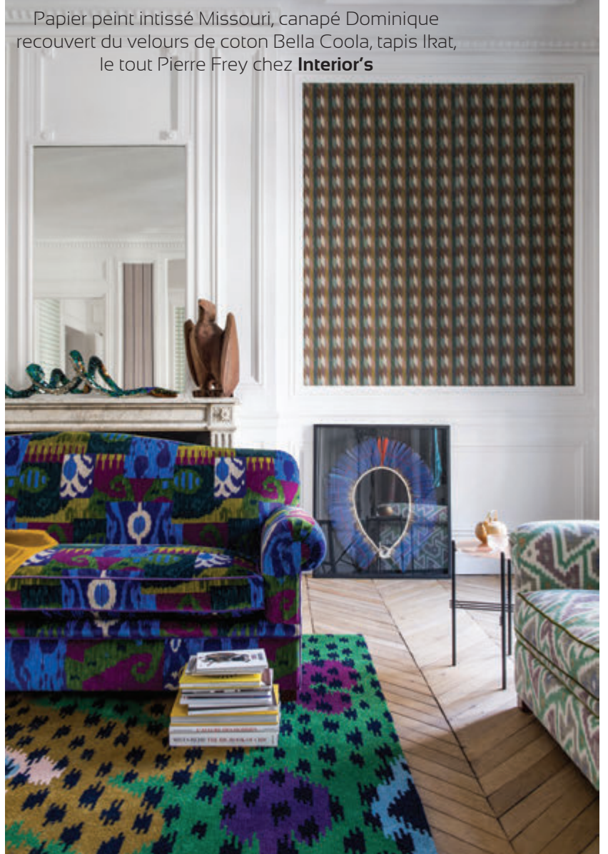
Papier peint intissé Missouri, canapé Dominique recouvert du velours de coton Bella Coola, tapis Ikat, le tout Pierre Frey chez Interior's