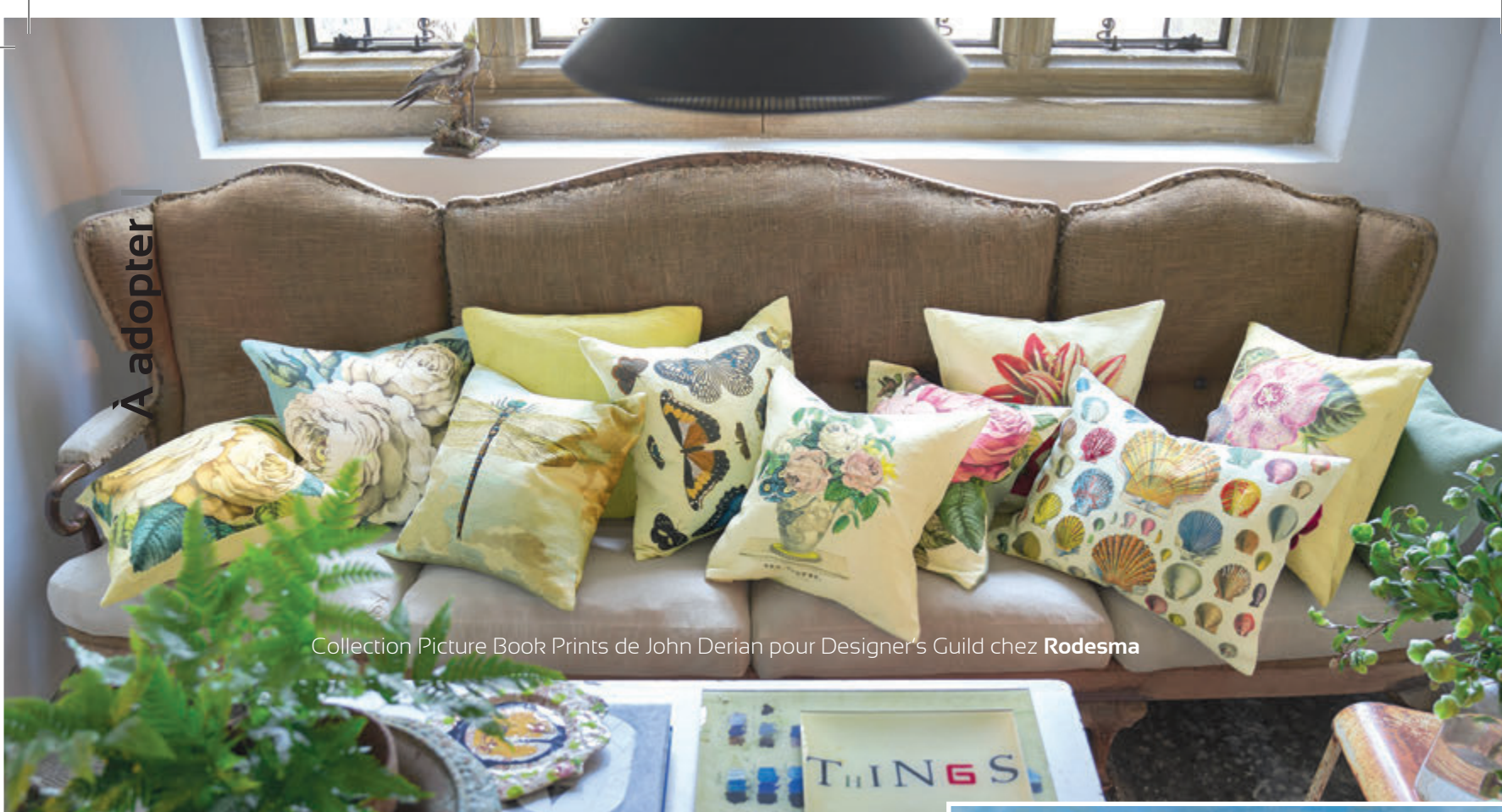
Collection Picture Book Prints de John Derian pour Designer's Guild chez Rodesma