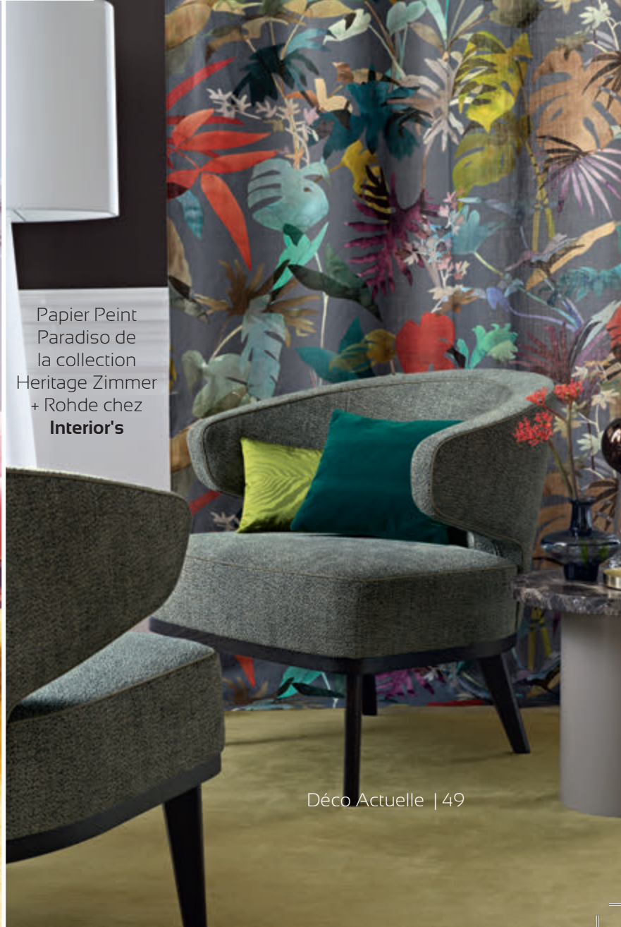
Papier Peint Paradiso de la collection Heritage Zimmer + Rohde chez Interior's