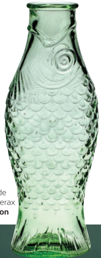
Carafe Fish & fish de Paola Navone pour Serax chez Landal Diffusion