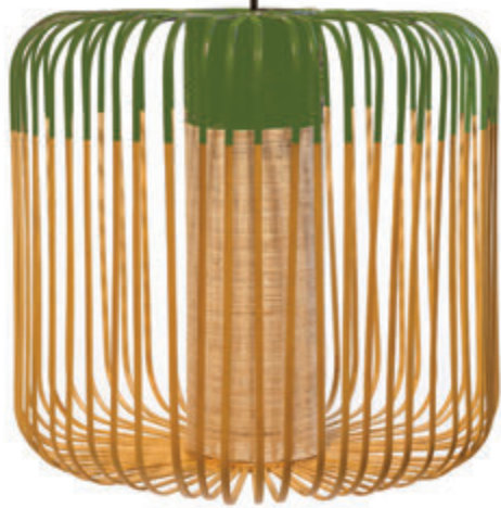
Suspension Bamboo Forestier chez Via Tortona