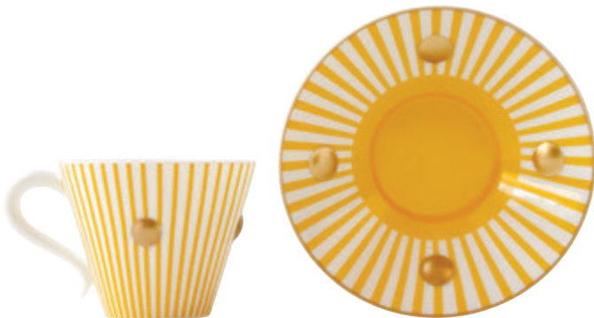
Tasse et sous-tasse Delphos Jaune Bernardaud chez Fenêtre sur Cour