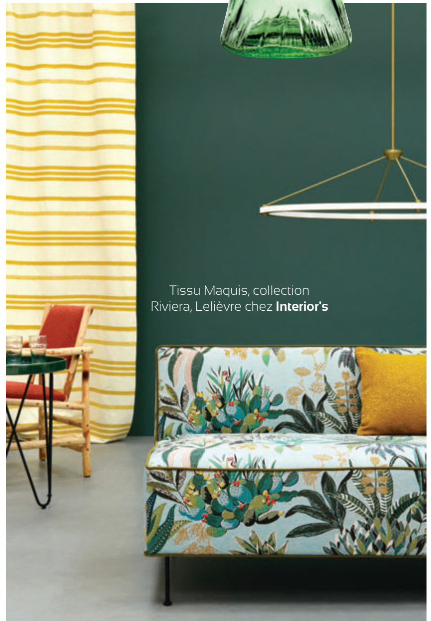
Tissu Maquis, collection Riviera, Lelièvre chez Interior's