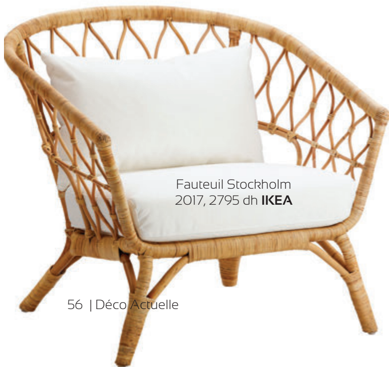
Fauteuil Stockholm 2017, 2795 dh IKEA