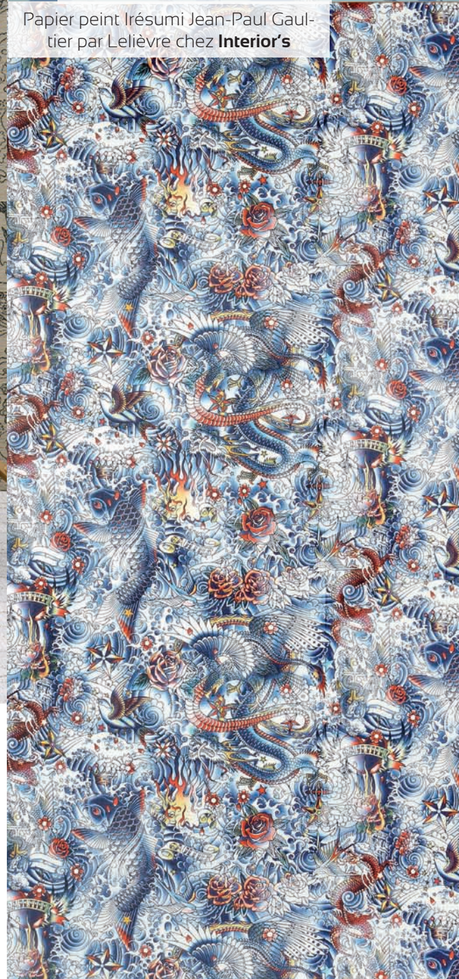
Papier peint Irésuni Jean-Paul Gaultier par Lelièvre chez Interior's