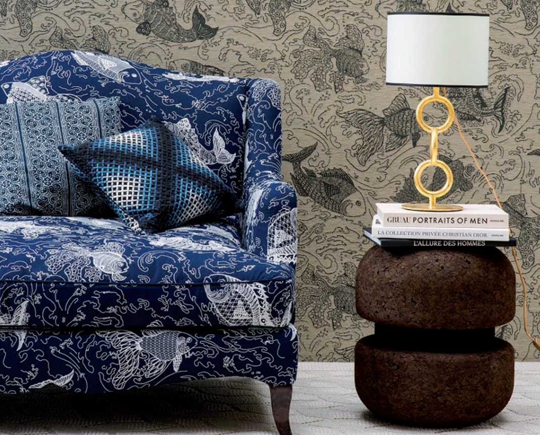
Broderie sur coton Lan Fish, collection Maoming Pierre Frey chez Interior's