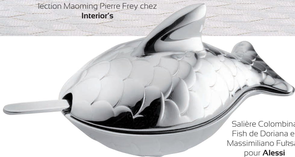
Salière Colombina Fish de Doriana et Massimiliano Fuksas pour Alessi